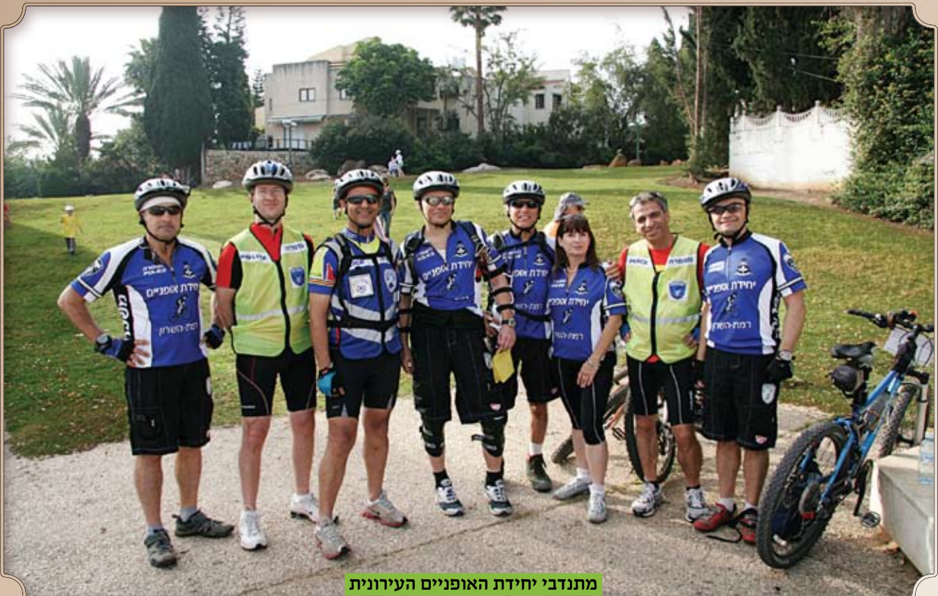
מתנדבי יחידת האופניים העירונית

צוות תגובה והיועצות עירוני. הצוות מהווה מודל עירוני ייחודי, המורכב מנציגי הרשות למניעת אלימות והתמכרויות, מנהלת אגף החינוך, מנהלת אגף הרווחה ומנהלת קידום נוער, השרות פסיכולוגי, מפקחי משרד החינוך. אליהם מצטרפים, עפ"י הצורך, נציגי משטרה, שרות מבחן, פקידי סעד וכן מנהלי בתי ספר וגננות. הצוות נועד לטיפול באירועי אלימות, בריונות, וונדליזם וכן שימוש בסמים בעיר.