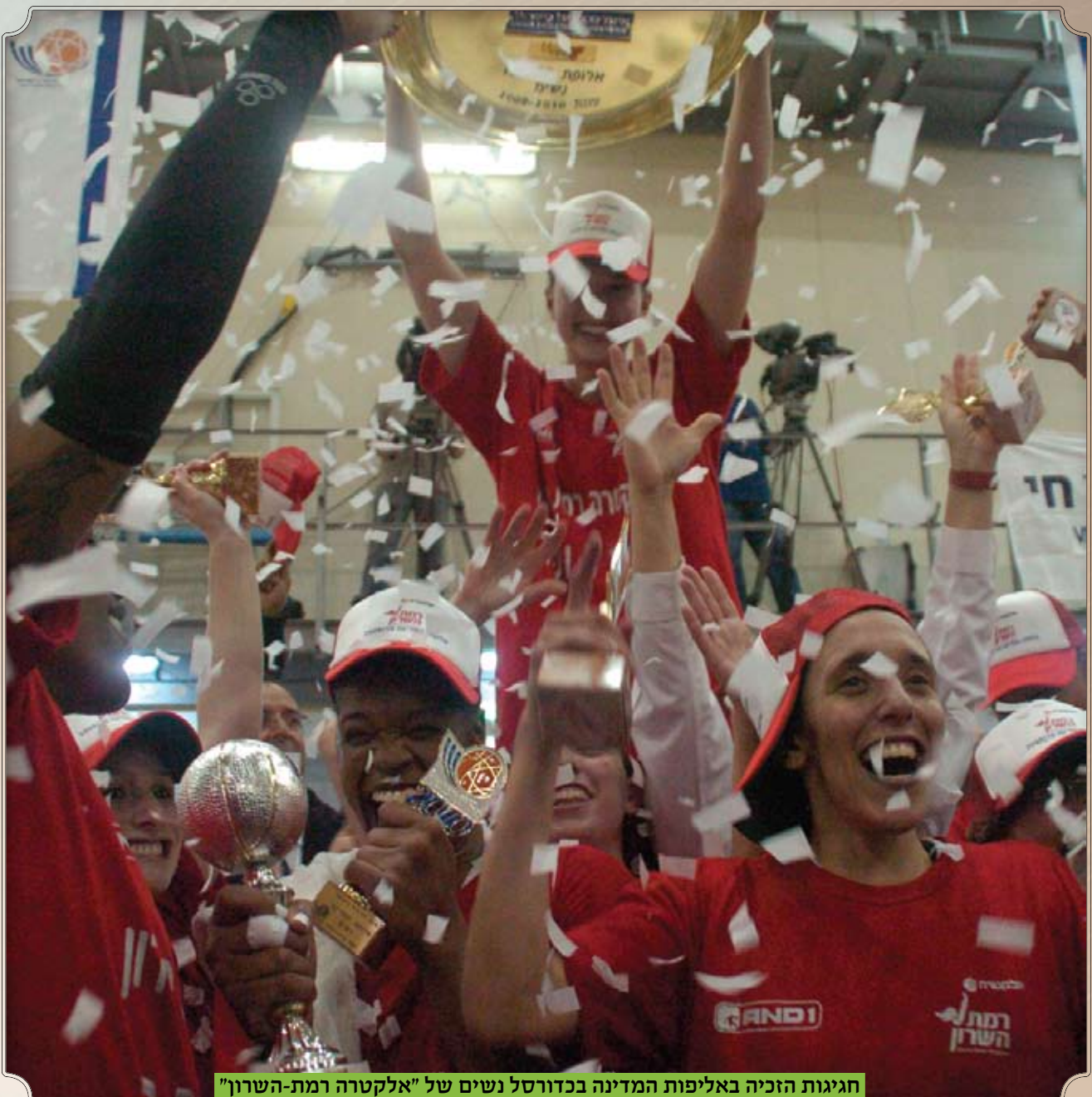
חגיגות הזכייה באליפות המדינה בכדורסל נשים של "אלקטרה רמת-השרון"

א. טיפוח הספורט ההישגי תחרותי והאולימפי [ במידה ויהיו] - השקעה וטיפוח ספורטאים תושבי רמה"ש, וכן שדרוג בענפי הספורט התחרותי של תושבי ובני רמה"ש. ב. המשך שיתוף הפעולה עם מוסדות הספורט בישראל. המשך פיתוח ספורט ההישגי ולנוער בפרט, לנבחרות בתיה"ס חט"ב "עלומים" ובתיכון "רוטברג". 4. קידום ספורט נשים, פעילות ספורט לנוער, לגיל השלישי ולגיל הרך אגודת הספורט מסייעת בחינוך הגופני והספורט לטיפוח בני נוער רבים, הגיל השלישי (ככל שניתן) והגיל הרך בספורט הישגי ועממי ובכלל.