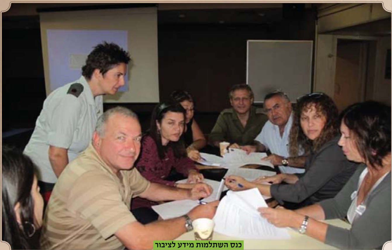
כנס השתלמות מידע לציבור