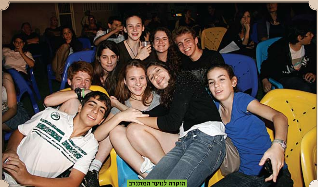
הוקרה לנוער המתנדב

תחום ארגון, מינהלה וזכאות מעטפת ארגונית של