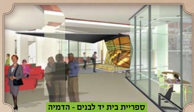
ספריית בית יד לבנים - הדמיה

בית יד לבנים - שיפוץ האודיטוריום במימון העירייה. פורסם מכרז ונבחר קבלן לביצוע השיפוצים בבית יד לבנים. העבודות כוללות הרחבה ושיפוץ יסודי של האולם ושל הבמה, התאמת המבנה לדרישות כבוי אש, בטיחות, נגישות, אקוסטיקה, משרד הבריאות. בנוסף ישופץ הלובי בקומת קרקע ובקומה שנייה.