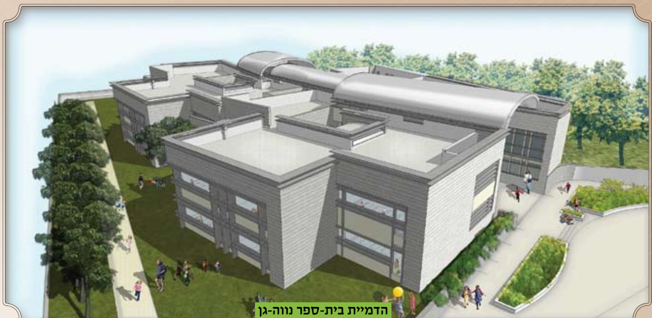
הדמיית בית-ספר נווה-גן

א. תגבור שעות סיוע לתלמידים לצד הכשרת סגלי החינוך והרחבת התוכניות והפעולות עבור אוכלוסיות בעלות צרכים ייחודיים. תוספת שעות סיוע לשילוב תלמידים בעלי צרכים מיוחדים במסגרות הלימוד הרגילות; פיתוח תוכניות אישיות לתלמידים; הכשרת הסגל החינוכי באמצעות השתלמויות, הדרכה וליווי לצוותים מגיל מעונות יום וגנים פרטיים ועד בתי-הספר התיכוניים; הקמת מסגרות הדרכה להורים; פיתוח מנגנוני תמיכה: ועדות להיוועצות, למעקב, צוותי היגוי וקיום ועדה לילדים בסיכון בגיל הרך; פר"ח - מימון עירוני מלא לתוכנית. סטודנטים מאוניברסיטת תל-אביב פועלים בבתי-הספר האינטגרטיביים בעיר. שילוב מתנדבים במוסדות החינוך בשיתוף רכזת ארגוני המתנדבים העירונית.