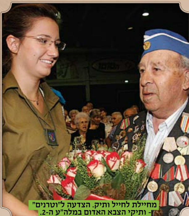
מחיילת לחייל ותיק. הצדעה ל"וטרנים" - ותיקי הצבא האדום במלה"ע ה-2.

"לכל איש יש שם" - בעקבות שיתוף פעולה עם "יד ושם" חברנו אליהם ועודדנו את התושבים ניצולי השואה למלא דפי-עד, במטרה שאף קורבן לא יישכח. זאת, על רקע העובדה שבעוד שלמעלה ממחצית שמות הנספים מתועדים במאגר המרכזי של שמות קורבנות השואה, שמות של מיליוני קורבנות עדיין חסרים, הנצחת הנספים עבור הניצולים היא בעלת חשיבות עצומה במיוחד כעת, בערוב ימיהם, כשרבים מהם מבינים ששמות יקיריהם עלולים להשכח לנצח.