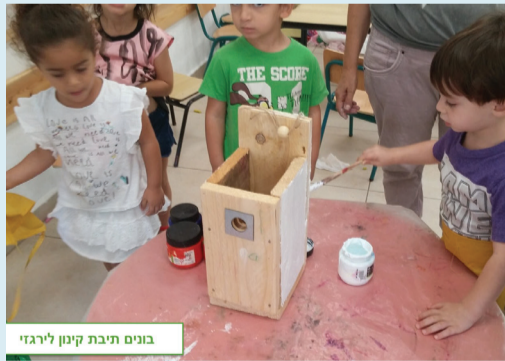
בונים תיבת קינון לירגזי