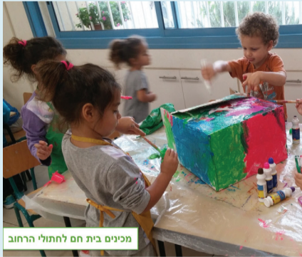
מכינים בית חם לחתולי הרחוב