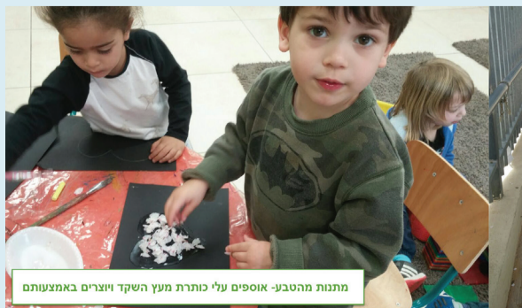
מתנת מהטבע- אוספים עלי כותרת מעץ השקד ויוצרים באמצעותם