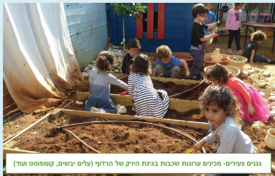
גננים צעירים- מכינים ערוגות שכבות בגינת הירק של הרדוף (עלים יבשים, קומפוסט ועוד)