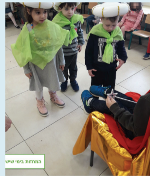
התחזות בימי שישי