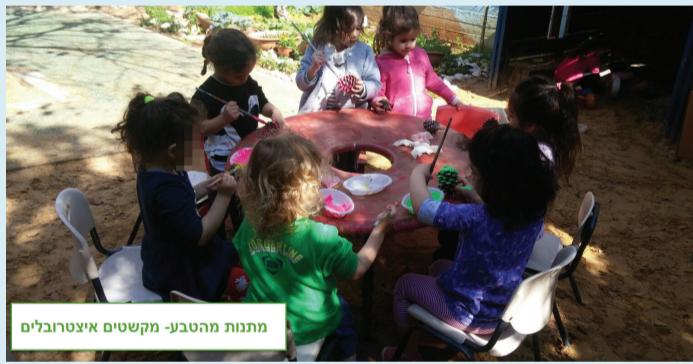
מתנת מהטבע- מקשטים איצטורבלים

אנו ממתינים לבלוב עצי התות כדי להוציא את ביצי טוואי המשי מהקרור ולהתחיל בגידול (האכלת) הזחלים, ולמידת הגלגול המלא. לא ניתן להישאר אדישים לתהליך.