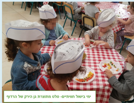
ימי בישול חויתיים- סלט מתוצרת גן הירק של הרדוף